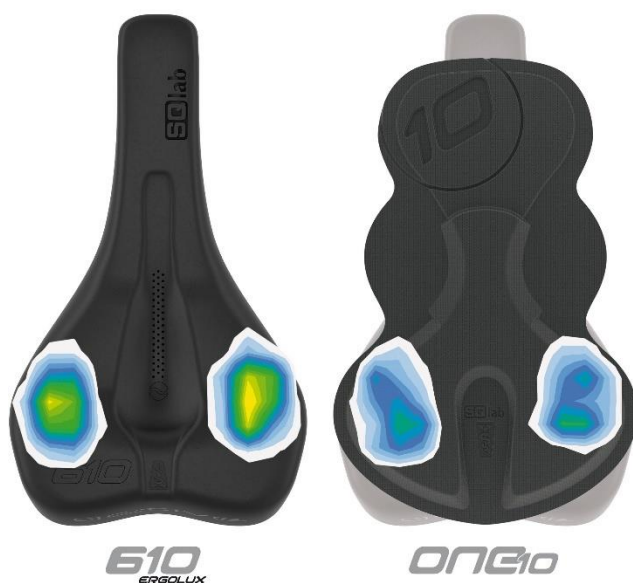
Image: Comparaison de la répartition moyenne de la pression sur la selle: le TPE supersoft répartit uniformément la pression, les pics de pression sont écrêtés.