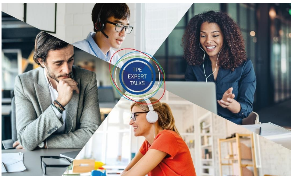
Foto: TPE Expert Talks ofrece diferentes formatos para clientes, socios y personas interesadas del sector, y de manera gratuita les proporciona consejos, trucos y conocimiento especializado. (© KRAIBURG TPE)